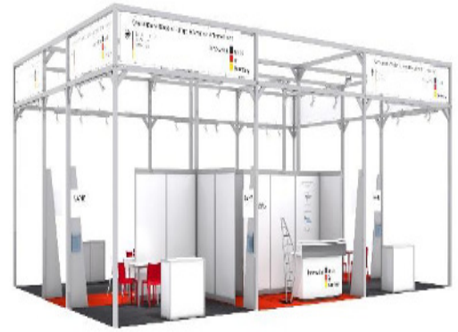
beispielhafte Darstellung des Standbaus

www.auma.de/de/ausstellen/foerderungen/foerderungen-in-deutschland