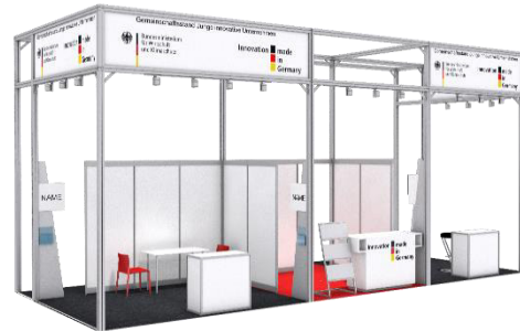
beispielhafte Darstellung des Standbaus

www.auma.de/de/ausstellen/foerderungen/foerderungen-in-deutschland