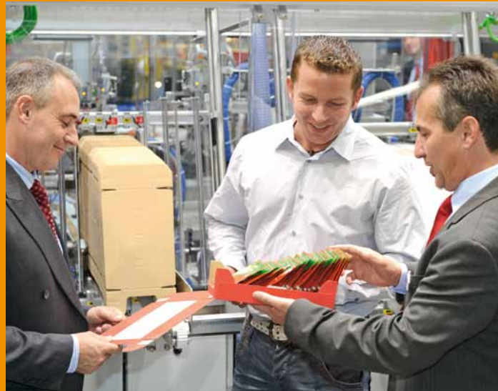
So sieht Wissen aus!

Freuen Sie sich auf eine Messe, verpackt in ein angenehmes Flair und den Charme der Stadt Nürnberg. Der erfrischende Mix aus historischer Kaiserstadt und pulsierender Metropolregion lädt zum Verweilen, Entspannen und Genießen ein. Unsere persönlichen Tipps und Empfehlungen haben wir unter fachpack.de/after-work für Sie zusammengestellt.