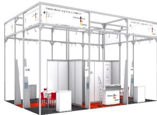
beispielhafte Darstellung des Standbaus

www.auma.de/de/ausstellen/foerderungen/foerderungen-in-deutschland