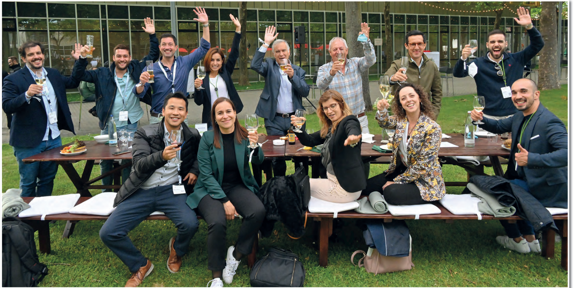
Yesterday's Interzoo party was outdoors in the Messepark for the first time. The weather played along and so party-goers were able to relax and celebrate outside from 6 pm onwards.