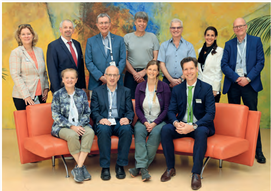
The European Pet Organization met at the Interzoo for the annual meeting. Die European Pet Organization traf sich auf der Interzoo zur Jahresversammlung.